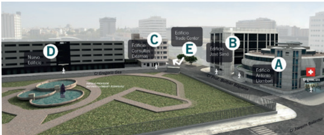
Complejo Hospitalario IVO